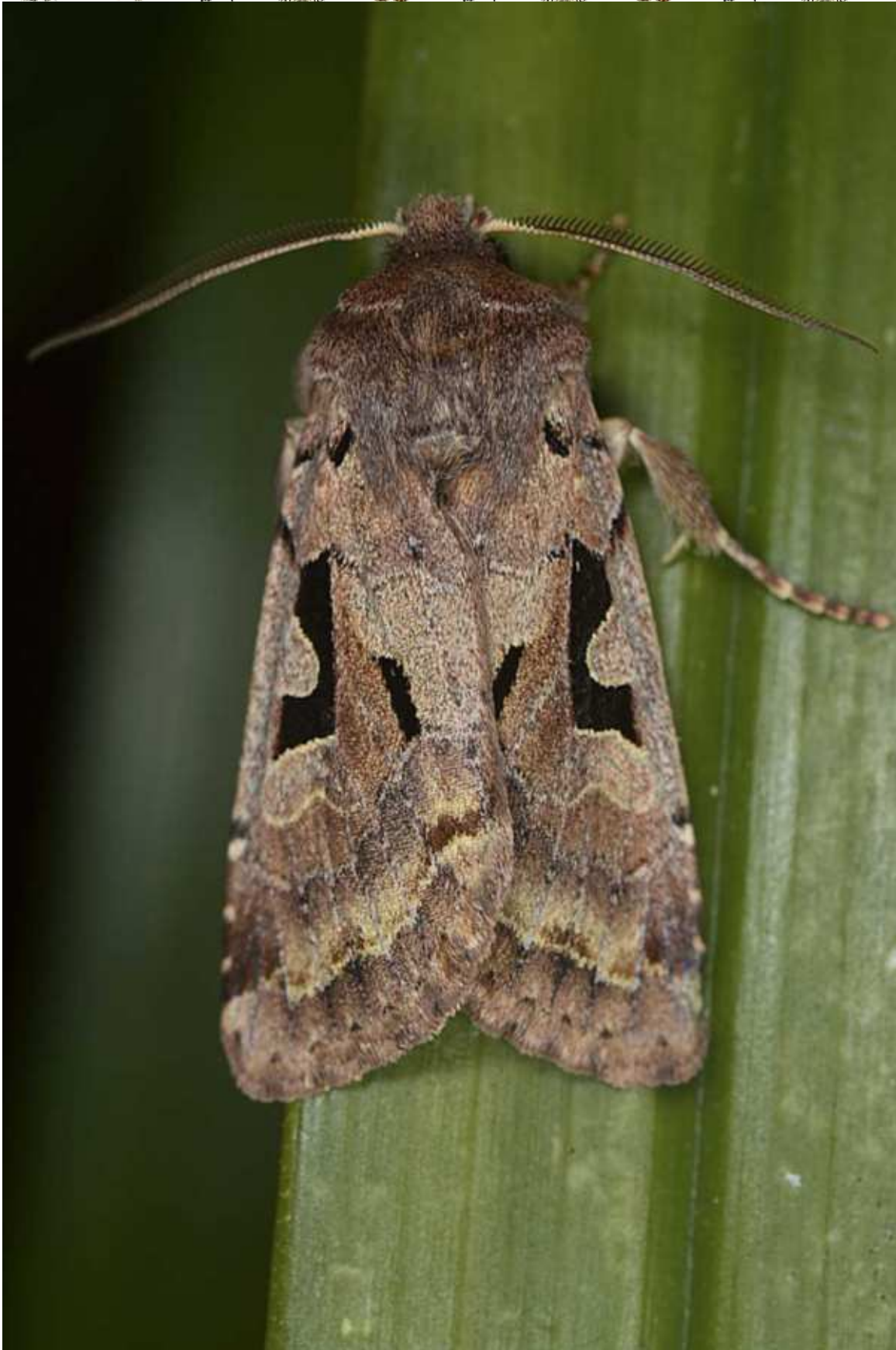
Orthosia (Semiophora) gothica (Linnaeus, 1758)