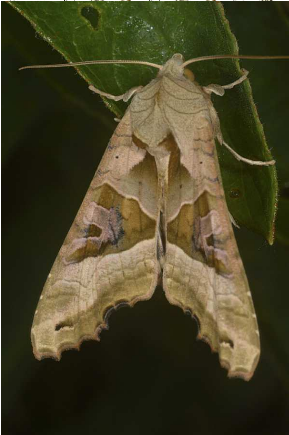
Phlogophora meticulosa L. 1758