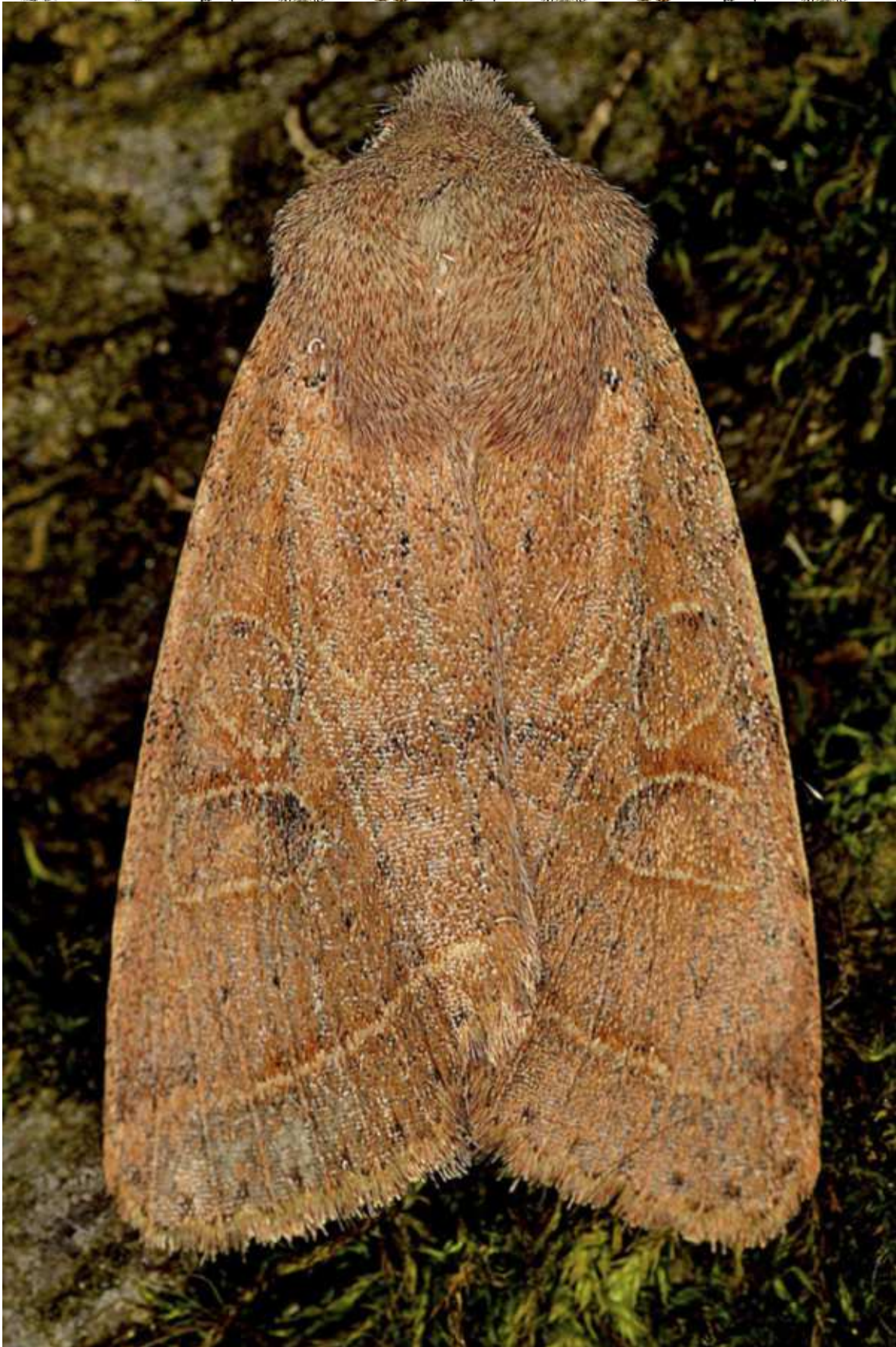
Orthosia (Monima) cerasi (Fabricius, 1775)