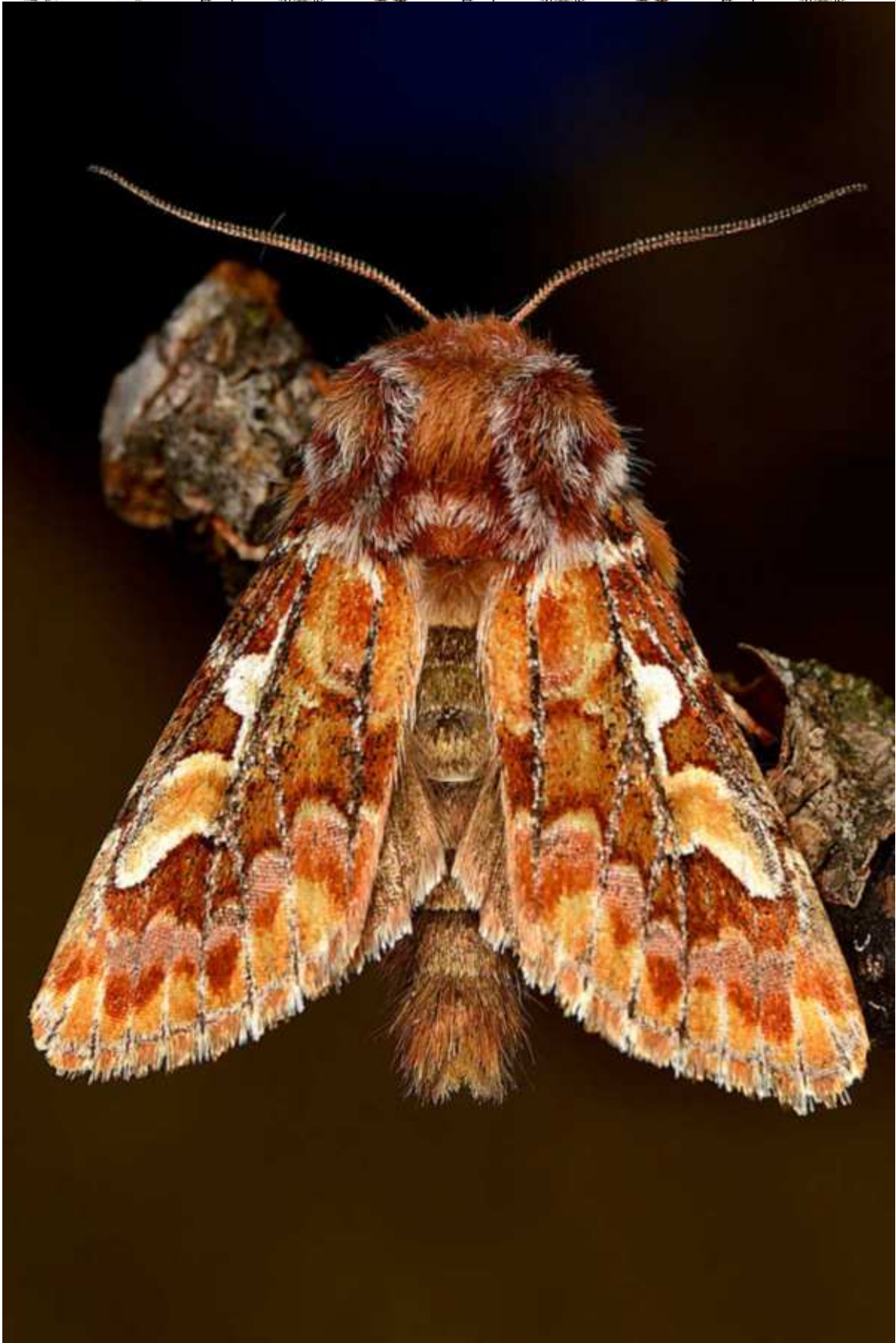
Panolis flammea (Denis & Schiffermüller, 1775)