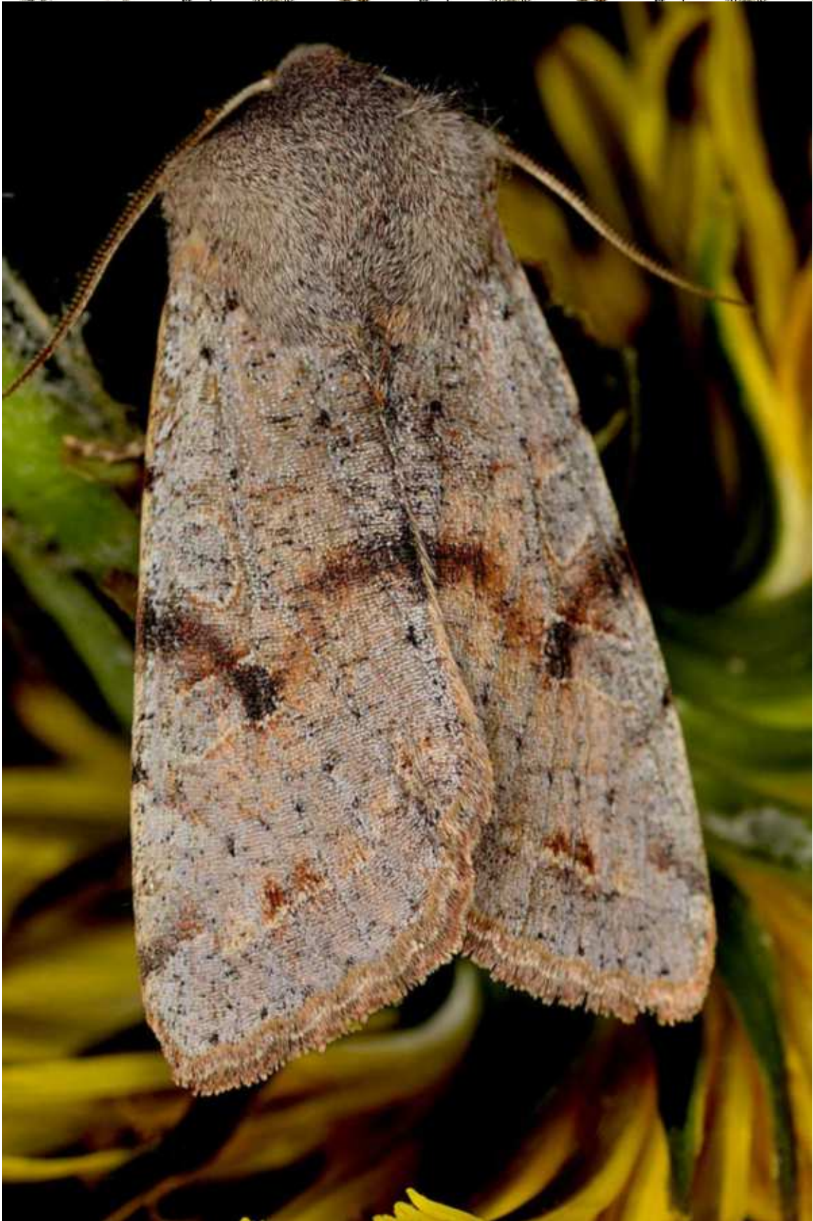
Orthosia (Orthosia) incerta (Hufnagel, 1766)