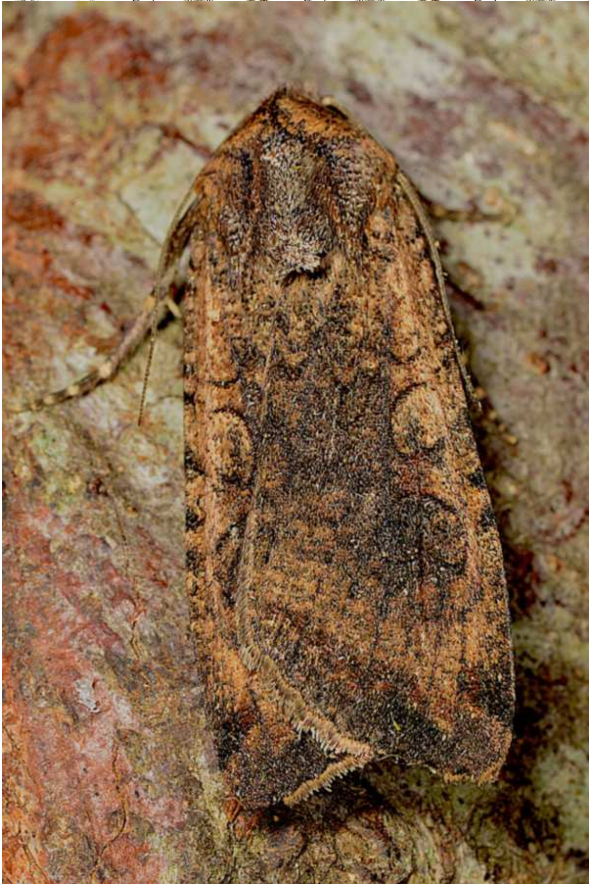
Peridroma saucia (Hübner, 1808)