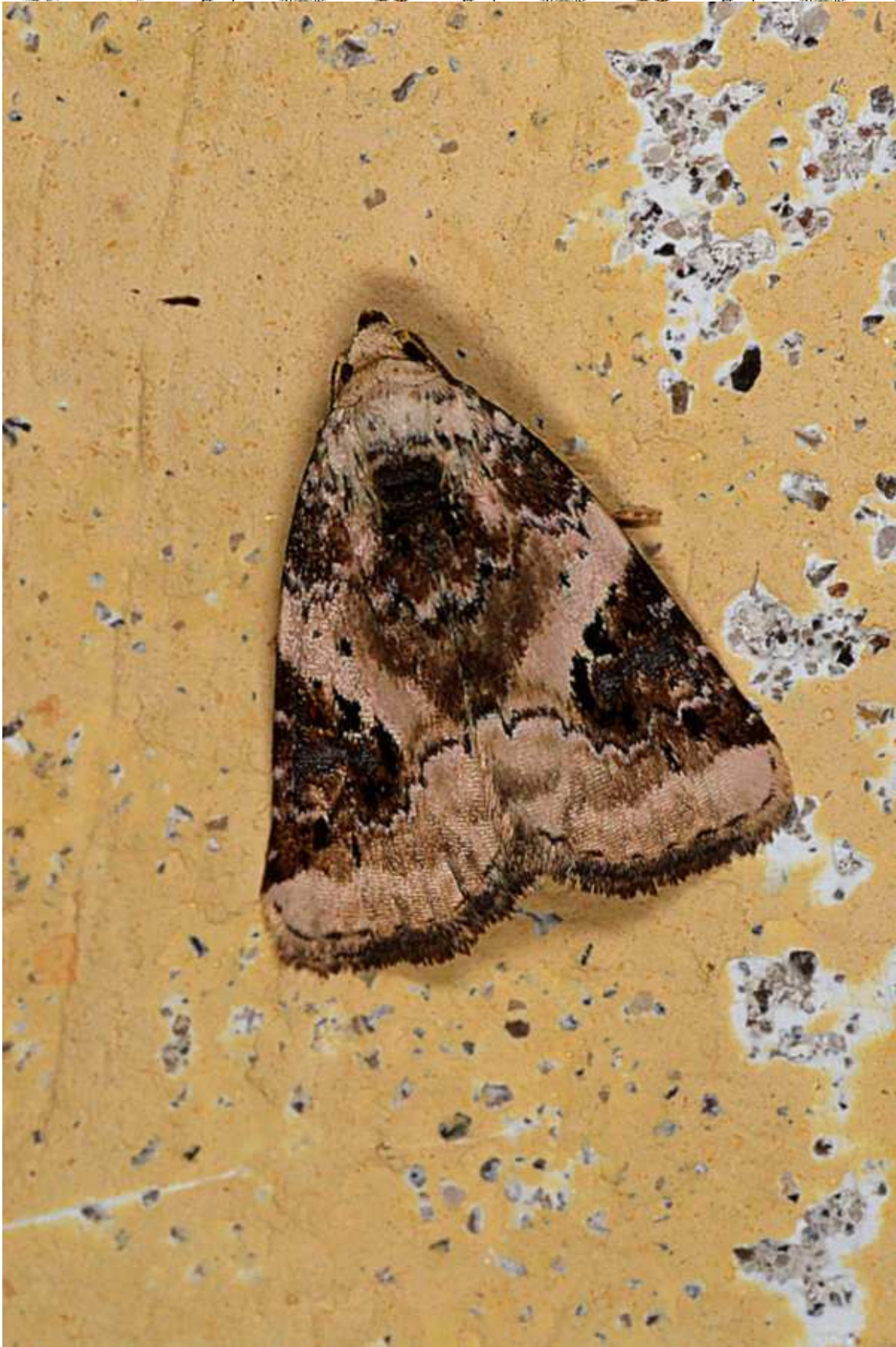
Pseudeustrotia candidula (Denis & Schiffermuller, 1775)