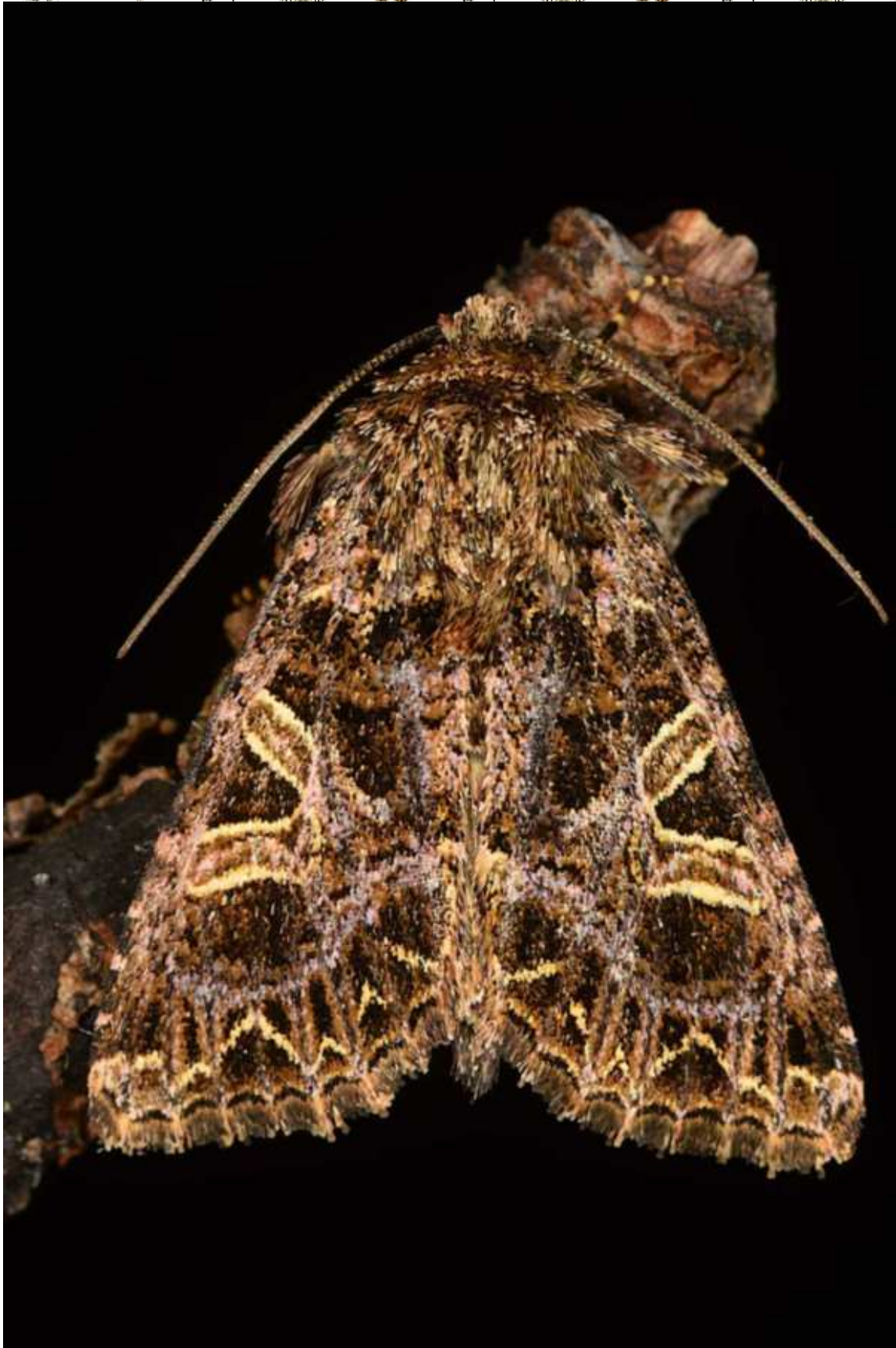
Sideridis (Aneda) rivularis Fabricius, 1775