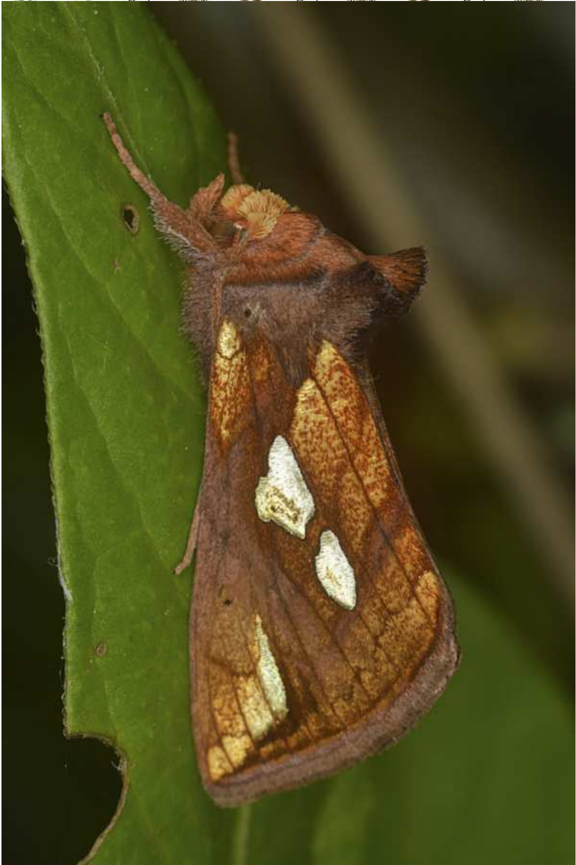
Plusia festucae (L. 1758)